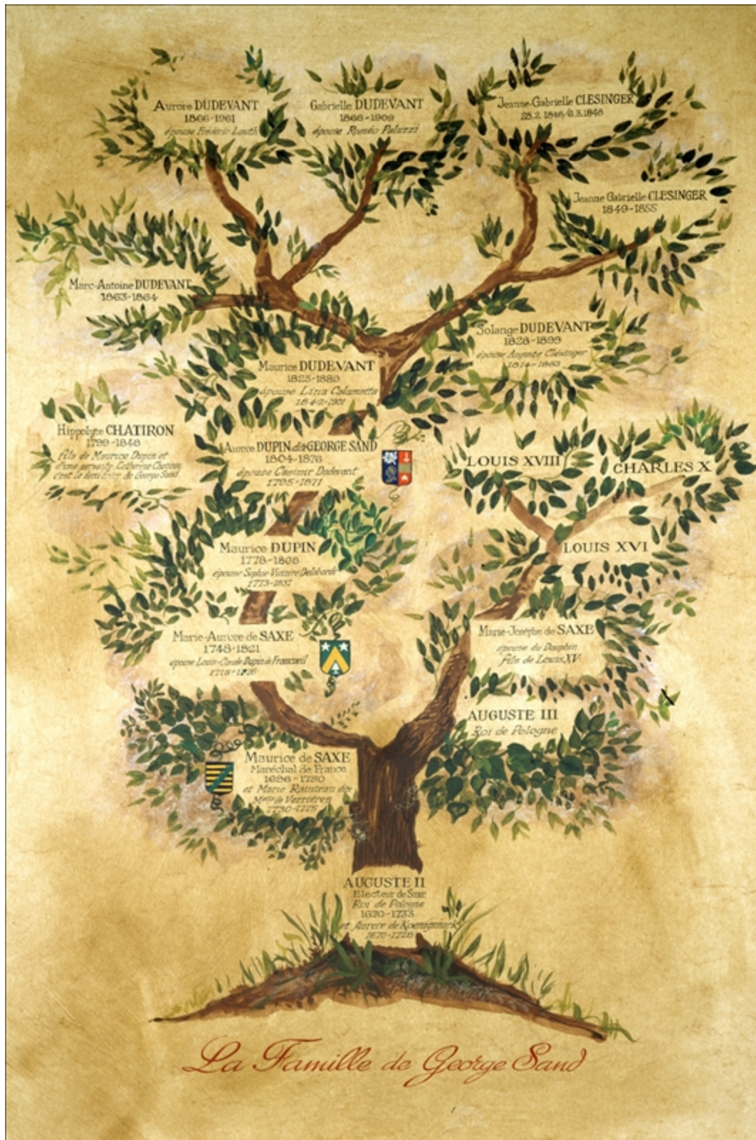
« Arbre généalogique de la famille Sand », estampe anonyme conservée au musée de la Vie romantique à Paris