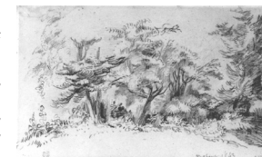
Vue du parc de Nohant, 1843 par Eugène Delacroix. Paris, musée de la Vie romantique.

romantiques. On y découvre une sculpture de Françoise Vergier (1991) évocation de Corambé, la divinité païenne inventée par