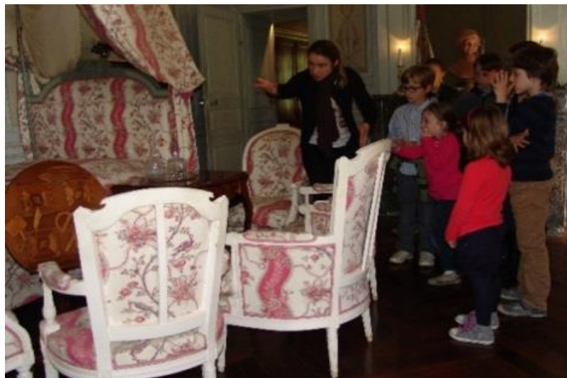
La maison de George Sand à Nohant