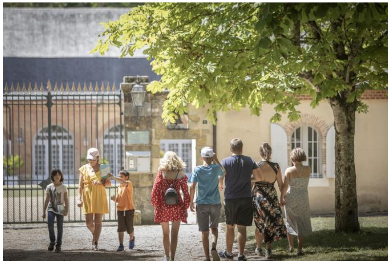
Le château de Bouges