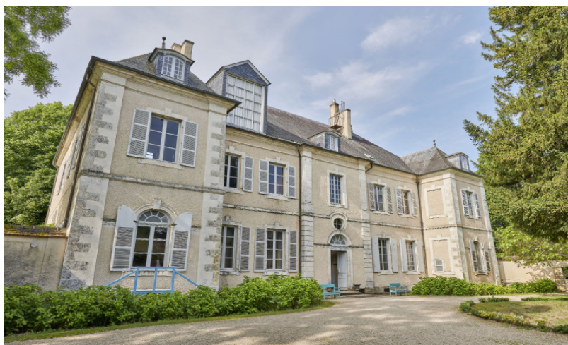
Maison de George Sand

Posée « au bord de la place champêtre sans plus de faste qu'une habitation villageoise » : ainsi George Sand évoque-t-elle sa demeure de Nohant, située au fond d'une cour entourée de dépendances. Construit à la fin du XVIII e siècle pour le gouverneur de Vierzon, ce petit château fut acquis en 1793 par Mme Dupin de Francueil, grand-mère de George Sand, qui l'entoura d'un vaste parc. C'est dans ce cadre que se déroulèrent l'enfance et l'adolescence de la petite Aurore Dupin. Devenue plus tard une auteure majeure du XIX e siècle, elle y écrivit la majeure partie de son œuvre et y reçut nombre d'hôtes illustres : Liszt et Marie d'Agoult, Balzac, Chopin, Flaubert, Delacroix qui y eut son atelier... L'intérieur de la maison a conservé le décor que l'écrivain connut jusqu'à sa mort : salle à manger, chambre bleue, petit théâtre et théâtre de marionnettes. La maison de George Sand à Nohant est ouverte au public par le Centre des monuments nationaux.