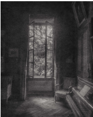
C'est de l'âme que vous jouiez