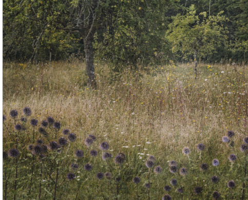
Le jardin était charmant