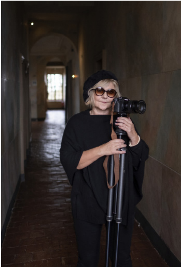
FLORE © Adrian Claret

FLORE est représentée en France par la galerie Clémentine de la Féronnière/Paris