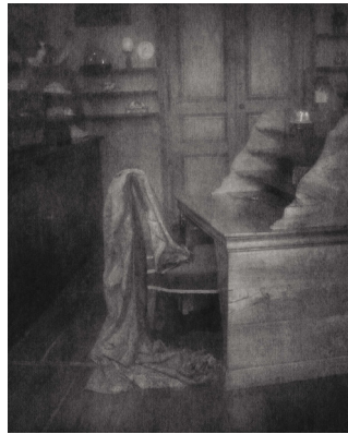
Votre exquise présence