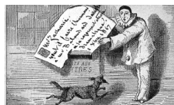
Invitación, dibujo de Maurice Sand.

Maurice y el pintor Eugène Lambert introducen en Nohant el teatro de marionetas. El primer escenario fue improvisado en el salón con dos sillas, una toalla y trozos de madera revestidos. Estas primeras experiencias teatrales serán evocadas ampliamente en una novela escrita en 1847, Le Château des Désertes . Sand transforma después una habitación de la