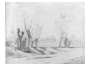
Nohant, septiembre 1857, París, museo de la Vida romántica.

George Sand escribe continuamente entre 1830 y 1876: novelas, cuentos, relatos, obras de teatro, artículos críticos y políticos, textos