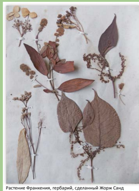
Растение Франкения, гербарий, сделанный Жорж Санд

Багрянник европейский (Cercis siliquastrum): родом из Южной Европы и Западной Азии. Яркие лилово-розовые цветки появляются в апреле и мае до листьев.